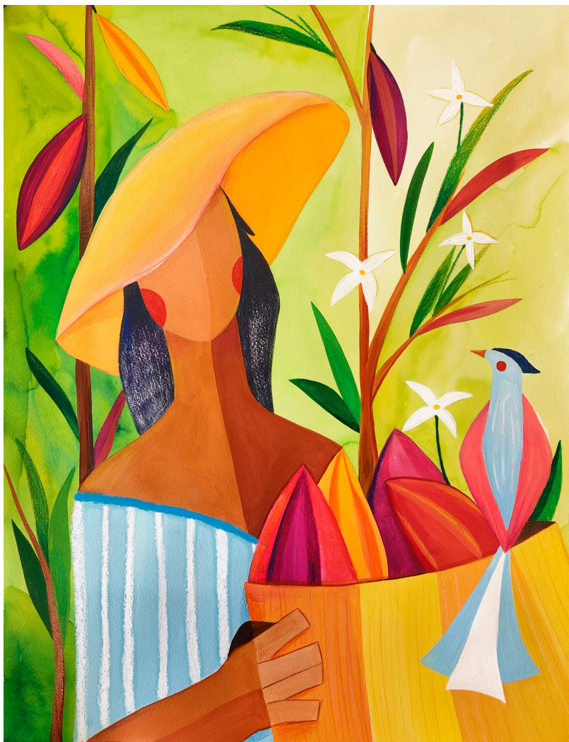
Alzira: Estudo nº 2