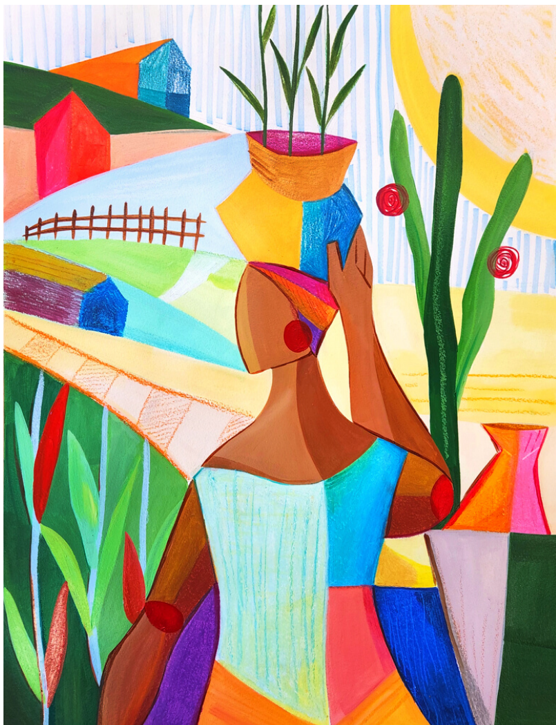
A Força que Nunca Seca: Estudo nº 1