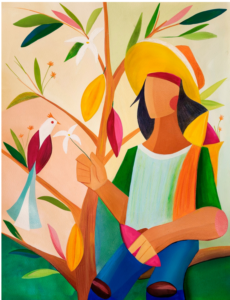
Alzira: Estudo nº 1