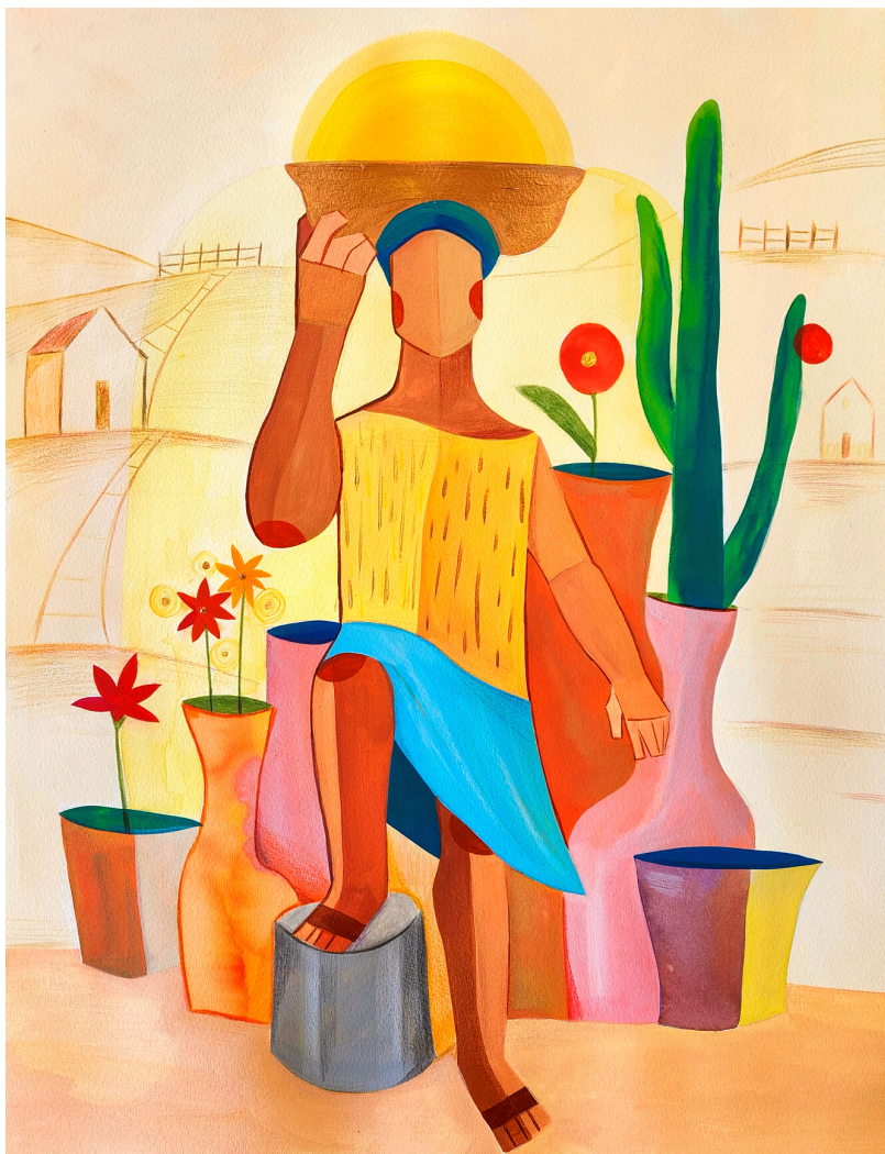
A Força que Nunca Seca: Estudo nº 3